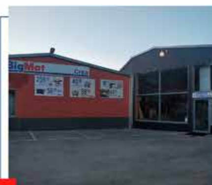
BIGMAT A CABANA 22 Ponteceso de cabana 15115 A Coruña Teléfono: 981 715 014