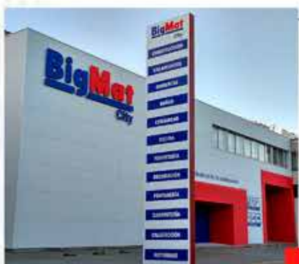
AV. Quinta 105, Polígono de PO.CO.MA.CO 15190 A Coruña, A Coruña Teléfono: 881 850 020

Con seis tiendas a su disposición, BigMat Crea pone al servicio de los expertos la más amplia variedad de materiales, herramientas, productos y servicios del mercado relacionados con el mundo de la construcción. Además, le ofrecemos servicios de asesoramiento, financiación y asistencia en obra para hacer de su trabajo una experiencia mucho más sencilla.