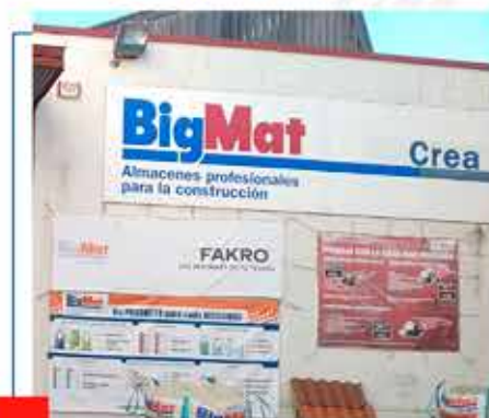
BIGMAT A CARBALLO Villa de Órdenes, 31 15100 Carballo, A Coruña Teléfono: 981 700 475

EL CENTRO para Profesionales de la CONSTRUCCIÓN en Coruña