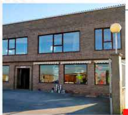
BIGMAT MALPICA Rúa Pedra Queimada, 1 15113 Malpica, A Coruña Teléfono: 981 715 014