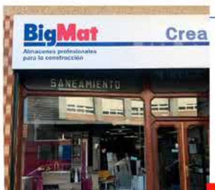
BIGMAT CARBALLO Fomento, 31 15102 Carballo, A Coruña Teléfono: 981 700 514