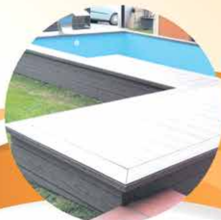
REVESTIMIENTOS Y FABRICACIÓN DE PISCINAS ENTERRADAS O SUPERFICIE