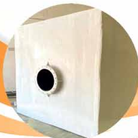
FABRICACIÓN DE DEPÓSITOS IN SITU