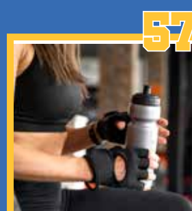
DEPORTE Y SALUD