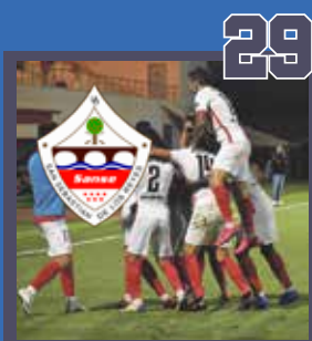
EL EQUIPO VISITANTE